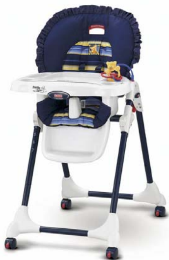
Chaise haute Healthy Care MC