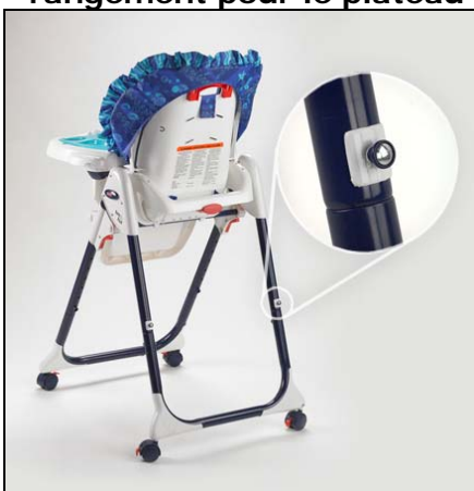
Chaise haute Healthy Care MC comportant une cheville de rangement pour le plateau