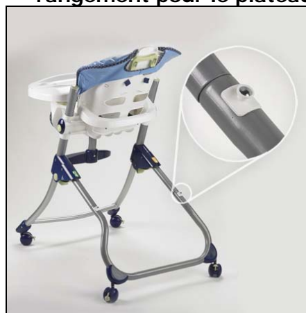
Chaise haute Close to Me MC comportant une cheville de rangement pour le plateau