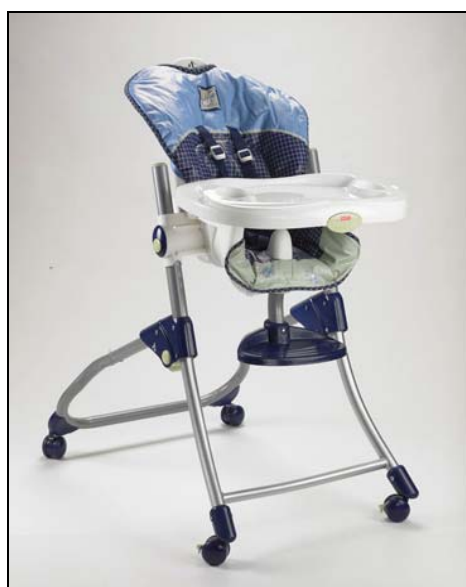
Chaise haute Close to Me MC